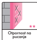
Otpornost na pucanje