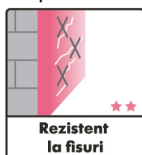
Rezistent la fisuri