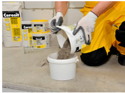
Turnați mortarul în apă