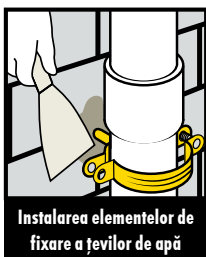
Instalarea elementelor de fixare a țevilor de apă