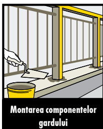
Montarea componentelor gardului