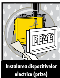
Instalarea dispozitivelor electrice (prize)