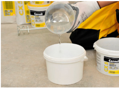
Măsurați cantitatea necesară de apă