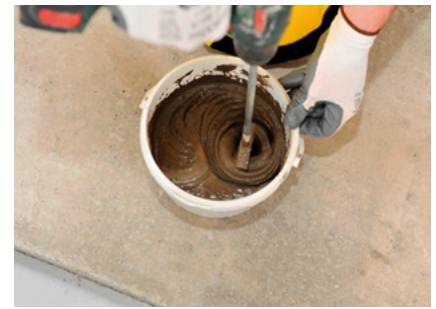
Amestecați cca 30 sec. până la obținerea unui amestec omogen, fără cocoloașe