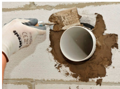
Fixați cu mortarul Ceresit CX 5 Express (umeziți în prealabil suprafața)