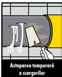
Astuparea temporară a scurgerilor