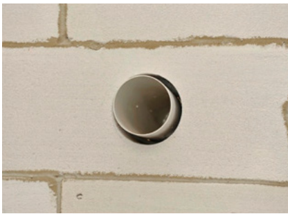
Așezați elementele în poziția corectă