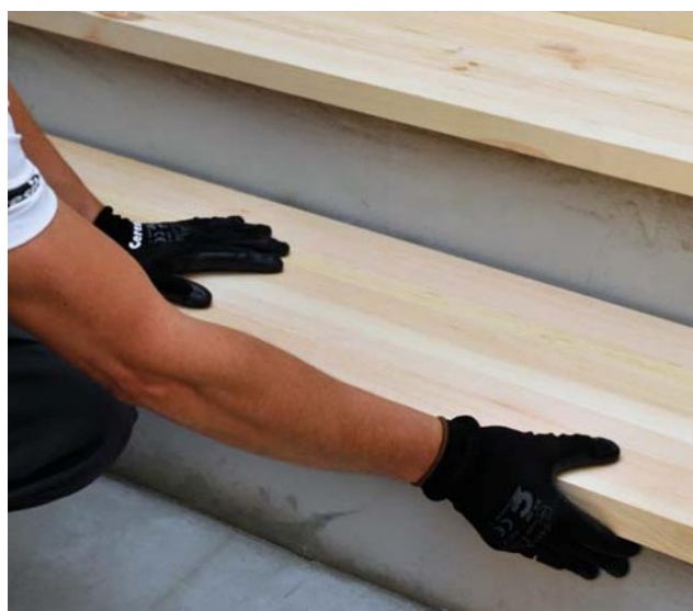
Pakāpiena uzstādīšana un tā stabilizēšana.

2. Pēc pakāpienu uzstādīšanas pareizā pozīcijā tas jānostabilizē 45–60 minūtes.