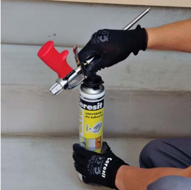
Pistoles uzskrūvēšana uz tvertnes

Iepakojuma tvertnes temperatūrai jābūt no +5°C līdz +30°C. Pirms lietošanas tvertne ar putām jāuzglabā istabas temperatūrā vismaz 12 stundas. Pirms darbu sākšanas tvertne jāsakrata apmēram 20 reizi, jānoņem no tvertnes uzgaļa drošības vārsts un stingri jāuzskrūvē pistole.