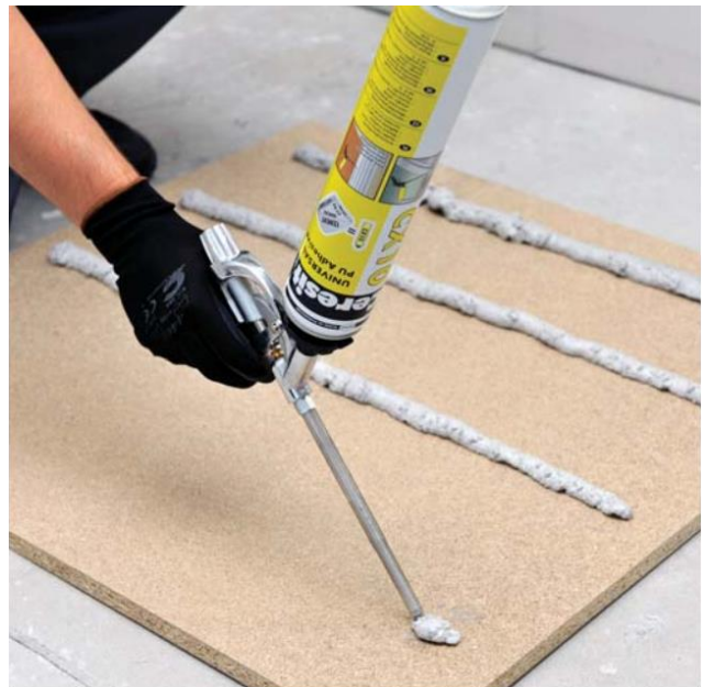
Putu uzklāšana uz plāksnes