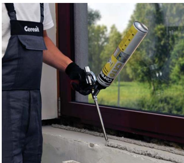
Palodzes montāža ar putu palīdzību

attālumu no malas). Ja materiāla biezums ir mazāks par 11,5 cm, jāuzklāj tikai viena josla.