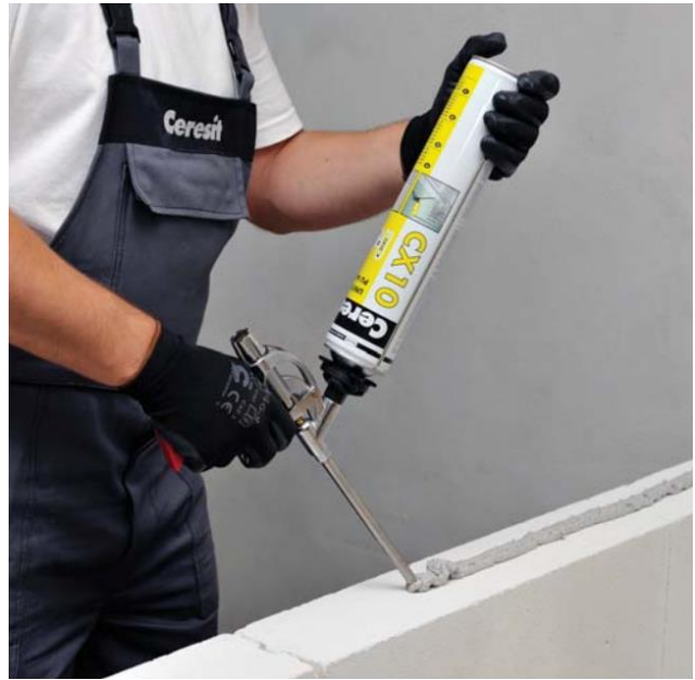
Putu lietošana šūnbetona bloku mūrēšanas darbos

PIEZĪME! Nelietot bloku ar izmēra pielaidi >1 mm neregulāru formu savienošanai. Nelietot nesošo sienu mūrēšanā, paredzēts tikai starpsienām.