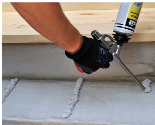
Kāpņu montāža, izmantojot putas.

1. Uzklāt uz virsmas paralēlas līmes joslas 2–3 cm diametrā ar 10–15 cm attālumu starp tām.