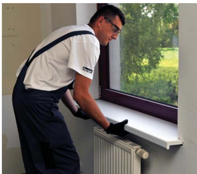
Palodzes ievietošana un tās stabilizācija.

2. Pēc precīzas palodzes uzstādīšanas to nepieciešams nostabilizēt 45–60 minūtes.