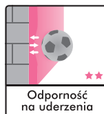
Odporność na uderzenia