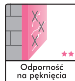
Odporność na pęknięcia