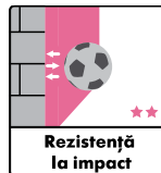
Rezistență la impact