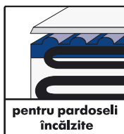
pentru pardoseli încălzite